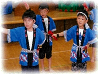
司会 頑張りました